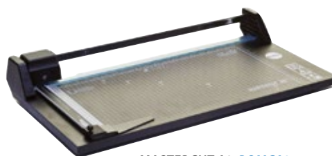
MASTERCUT A3 ROMCA3