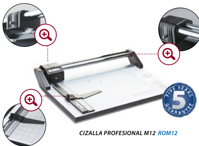
CIZALLA PROFESIONAL M12 ROM12

Corte hasta 3 mm de grosor. Tablero de madera con tratamiento antivejez.