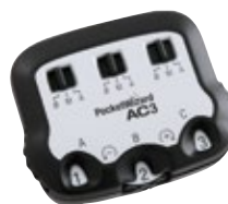
PocketWizard The Zone Controller Canon PWAC3C

AC3 Zone Controller sobre MiniTT1 en cámara