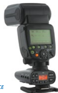
PocketWizard Plus IV Transceptor PWPLUS4CE