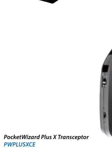
PocketWizard Plus X Transceptor PWPLUSXCE