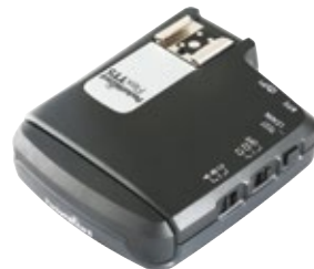
PocketWizard Transceptor FlexTT5 Nikon PWFLEXNCE