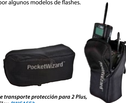
Bolso de transporte protección para 2 Plus, Mini o Flex PWCASE2