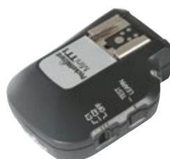
PocketWizard Transmisor MiniTT1 Canon PWMINICCE