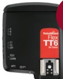
PocketWizard Transceptor FlexTT6 Canon PWFLEXTT6CCE