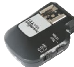
PocketWizard Transmisor MiniTT1 Nikon PWMININCE