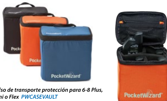
Bolso de transporte protección para 6-8 Plus, Mini o Flex PWCASEVAULT