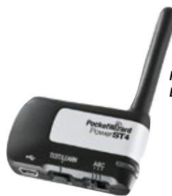
PocketWizard Power ST4 para Elinchrom RX PWST4

PWPLUSXCE2 Kit 2 PocketWizard Plus X Transceptor 144,00 € 2 x PocketWizard Plus X, 1 x cable espiral 30 cm conexión mini Jack 3,5 mm a sincro cámara/flash, 1 x cable espiral 30 cm mini jack 3,5 mm a mini jack 3,5 mm, 1 x adaptador mini jack 3,5 mm a jack estándar.