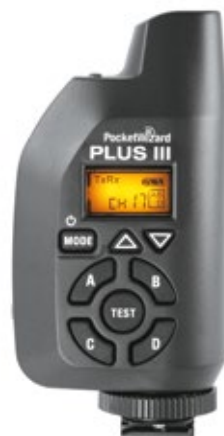
PocketWizard Plus III Transceptor WPLUS3CE